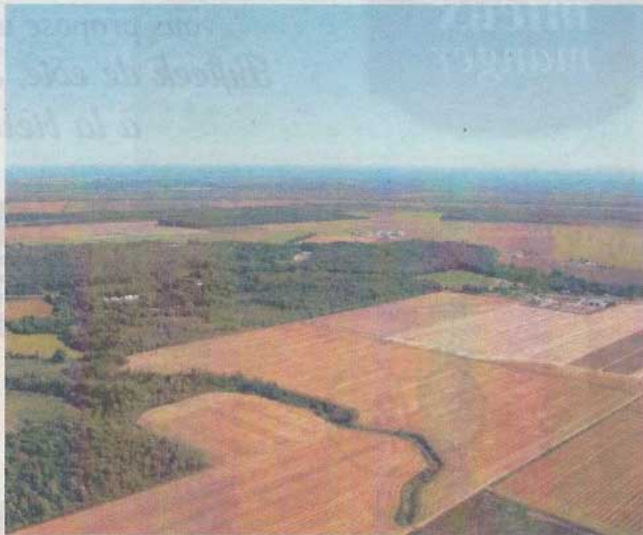
Plus de soixante propriétaires privés se partagent le massif boisé de Saint-Thomas, qui s'étend sur 1051 hectares et chevauche quatre municipalités du cœur de la région de Lanaudière.

Le massif du Boisé Saint-Thomas est bordé par les routes 131 et 158, à cheval sur les municipalités de Saint-Thomas, Notre-Dame-des-Prairies, Sainte-Élisabeth et Sainte-Geneviève-de-Berthier. En plus d'abriter une importante population de cerfs de Virginie, certaines parties de son territoire sont considérées comme des sites floristiques exceptionnels, très rares à l'échelle mondiale, des «alvars».