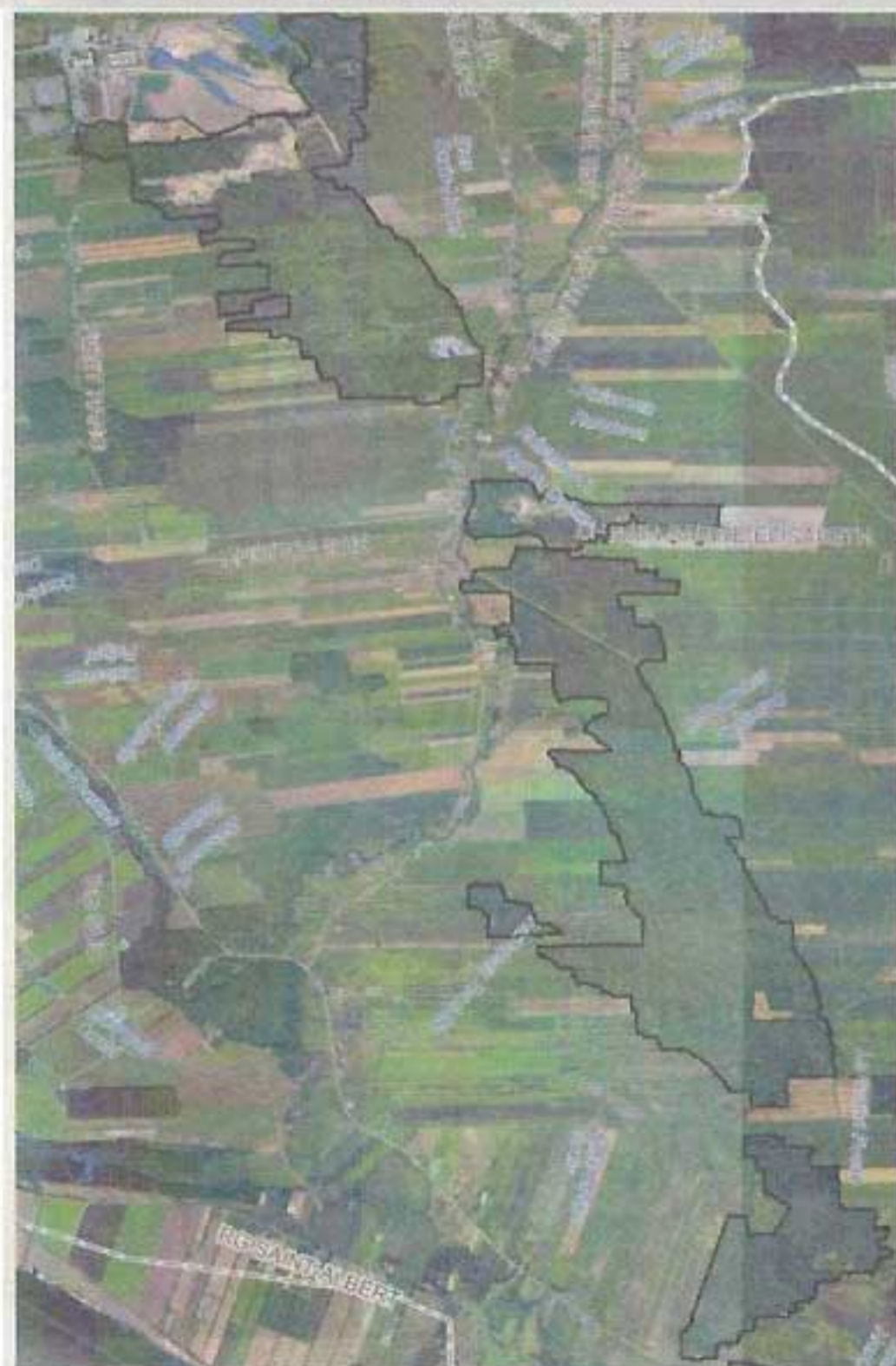
Cette carte montre les délimitations du massif boisé Saint-Thomas.

▶▶▶ Ce type d'écosystème est caractérisé par un sol très mince, à la surface d'un affleurement rocheux calcaire, et une biodiversité particulière. Notamment, le massif boisé Saint-Thomas abrite une des plus grandes populations d'orme liège, une espèce menacée, ainsi que l'érable noir, le trille blanc, et plusieurs autres plantes rares et menacées.